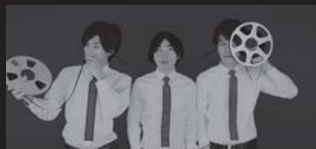
Open Reel Ensemble