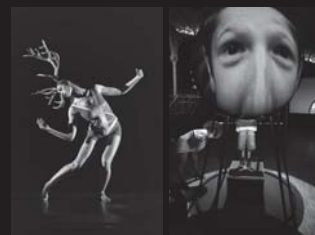
過去のフィリップ・ドゥックフレ演出作品より